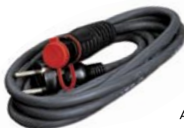
Anschlusskabel/MS (öl- und wasserresistent) mit Minikontakt-Steckdose