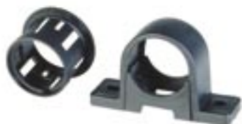
Überwurfmutter und Befestigungsklammer