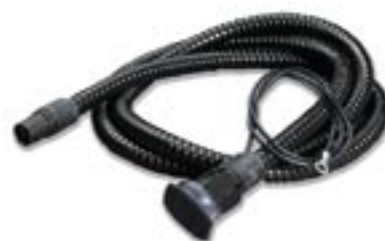
Einbaukabel, MK mit Minikontakt-Stecker