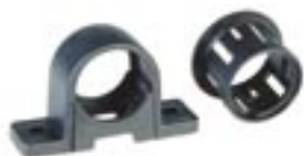
Befestigungsklammer & Überwurfmutter

Wenn Sie kein Loch in die Fahrzeugaußenhaut bohren möchten, können Sie die beiliegende Befestigungsklammer verwenden. Damit lässt sich das Minikontakt-System im Kühlergrill oder Lufteinlass montieren.