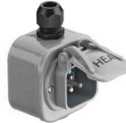
Type 133 K fiche avec couvercle à charnière **