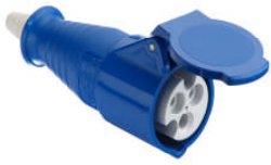
Type 513 CEE prise avec couvercle à charnière

Pour installer le chauffage de l'eau de refroidissement, sont des fiches et des prises suivantes disponibles: