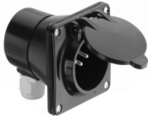
Type 12 Fiche encastrée **