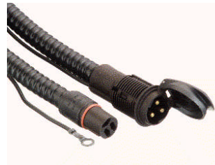
Câble d'installation pour le type C