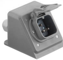
Type 133 KW „Coudée“ **

** Utilisable également dans les locaux humides