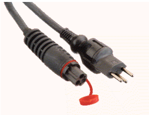
Câble de raccordement pour le type C

** Utilisable également dans les locaux humides