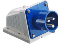
Type 513 CEE fiche