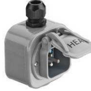
Typ 133 K Stecker mit Klappdeckel **