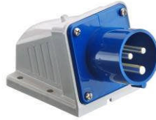
Typ 513 CEE Anbau Stecker