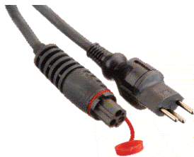
Anschlusskabel zu Ausführung C