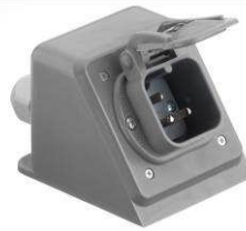
Typ 133 KW „Winkel“ **