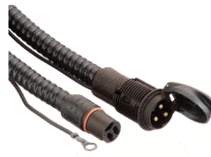
Einbaukabel zu Ausführung C