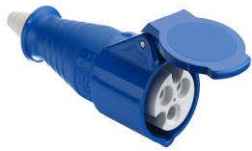
Typ 513 CEE Steckdose mit Klappdeckel

Um die Kuehlwasserwaermer zu montieren, stehen folgende Stecker und Steckdosen zur Verfuegung: