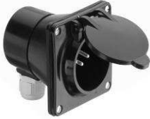
Typ 12 Einbaustecker **